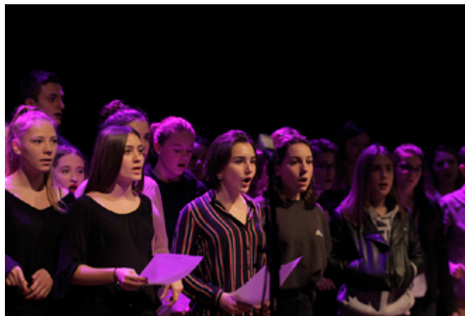
L'arrivée du jazz à Brest, Collège de l'Hateloire

En seulement trois mois, des élèves de seconde du Lycée pilote innovant international de Poitiers ont relevé le défi de réaliser une fiction sonore pour un projet interdisciplinaire français-espagnol. Ils ont non seulement écrit l'intégralité des textes mais aussi réalisé les bruitages et la mise en scène. Cette fiction raconte l'histoire d'un couple franco-espagnol cherchant à tout prix à éblouir leurs petits- enfants par le récit de leur rencontre.