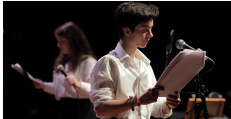
L'arrivée du jazz à Brest, Collège de l'Harteloire

Depuis septembre 2018, les élèves de 3 e section européenne du collège Camille Vallaux étudient les stéréotypes de genre, et plus précisément ceux que l'on retrouve dans la musique. Aux Capucins, ils présenteront sous forme d'émission radiophonique, entre capsules sonores et débat, le résultat de leur travail.