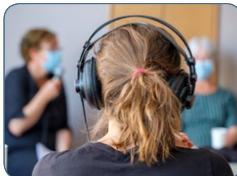
Atelier radio « Printemps vingt vingt »

2015-2020 : 3 580 jeunes accompagnés, soit 4 400 heures de pratique