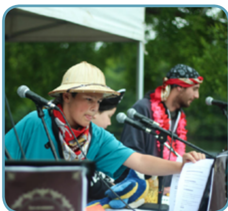
Fiction « Les mésaventures de Johnny Penfeld »