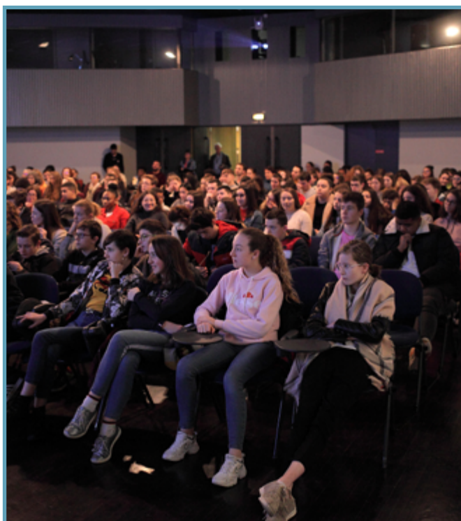
Remise du Prix de l'écoute des collégiens et lycéens (18 e Festival Longueur d'ondes)

Le festival des scolaires , temps fort de la programmation, accueille sur deux journées près de 3 500 élèves du primaire, du secondaire et de l'enseignement supérieur qui rencontrent des professionnels de la radio, animent des interviews, présentent des émissions, etc.