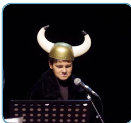
Fiction « Sacha et Tomcrouz »