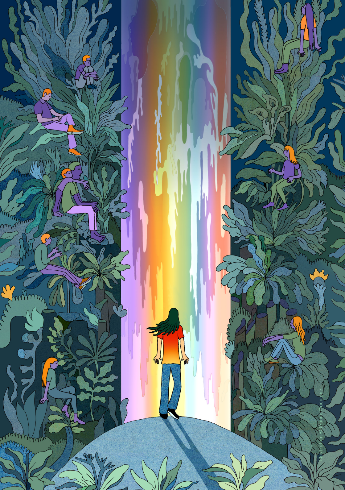
Illustration © Jeanne Macaigne